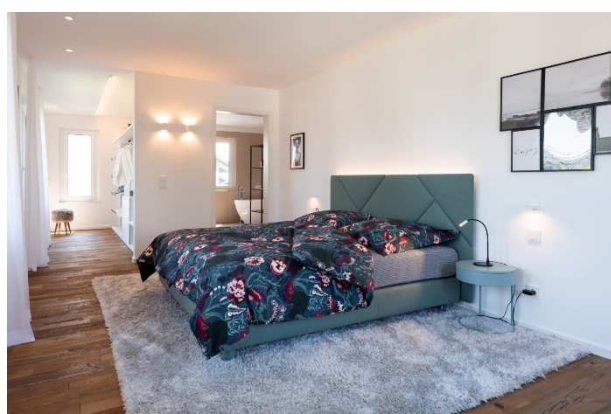
Bild: Schlafzimmer mit Ankleide und Bad