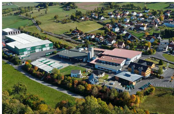
Bild: Werksansicht RENSCH-HAUS