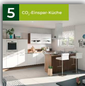
Bild: Paket 5 CO 2 -Einspar-Küche