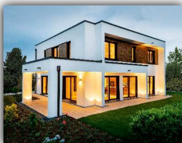
Bild: Energieeffizientes Musterhaus Victoria, aus Holz gebaut