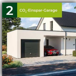
Bild: Paket 2 CO 2 -Einspar-Garage