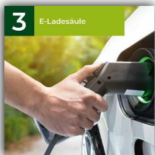
Bild: Paket 3 E-Ladesäule