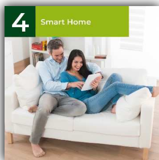
Bild: Paket 4 Smart Home